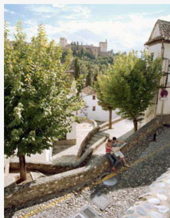
Opret din egen fortælling!

Når du har oprettet et OnSpotStory-system, er det meget let at lægge funktionen at lytte til og kigge på stederne ind på din egen hjemmeside. Med systemet får du et link, som bare skal klistres ind på din egen hjemmeside.