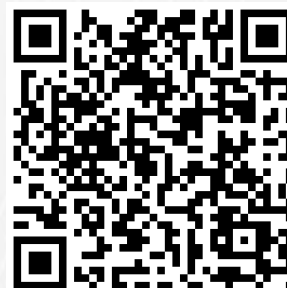
Til test af QR-kode