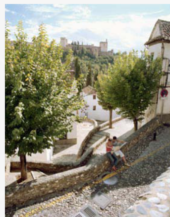
Luo oma tarinasi!

Kun OnSpotStory-järjestelmä on otettu käyttöön, siihen on helppo lisätä toiminto, jolla voidaan kuunnella ja katsella paikkoja verkkosivujen kautta. Saat järjestelmästä linkin, joka voidaan liittää omalle verkkosivulle.