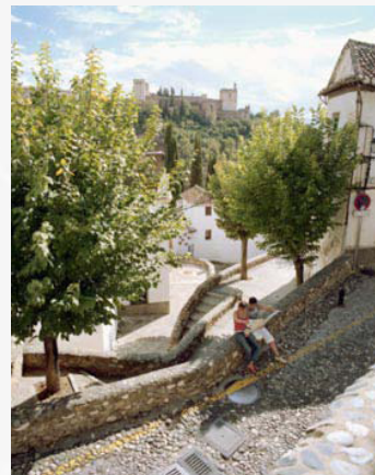
Skap din egen fortelling!

Når du så har lagt opp et OnSpotStory-system er det enkelt å legge inn funksjonen å høre og se på stedene på din egen hjemmeside. Via systemet får du en link som du limer inn på din egen hjemmeside.